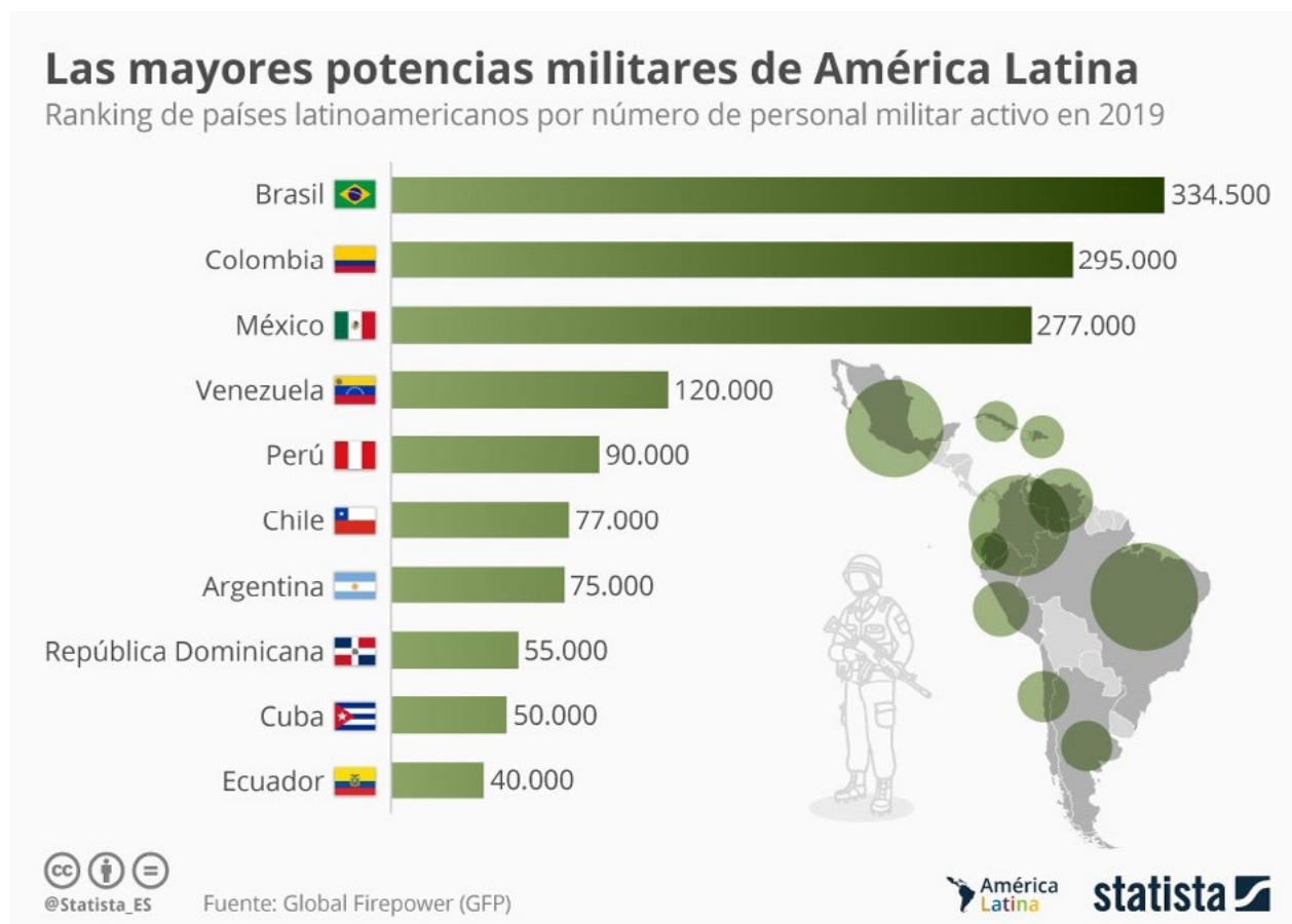
Grafico N° 1 Potencias militares de América Latina y el Caribe (2019) .

dad de armamento militar disponible y otros factores geopolíticos como flexibilidad logística, infraestructura y recursos naturales. En 2019, los países latinoamericanos mejor ubicados en dicho ranking fueron Brasil, México, Argentina y Perú (Pasquali M., 2019).